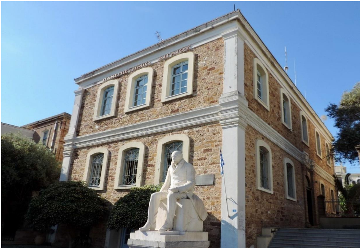
Φωτ..5: Τμήμα Ναυτιλίας και Επιχειρηματικών Υπηρεσιών, κτήριο Κοραή