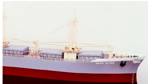
Φωτ.3: Λεπτομέρεια πλοίου χιώτικης ιδιοκτησίας

εμπορίου και των μεταφορών με την ακτινοβολία της παρουσίας της Μυροβόλου στο εμπόριο και στις θάλασσες του κόσμου για αιώνες.