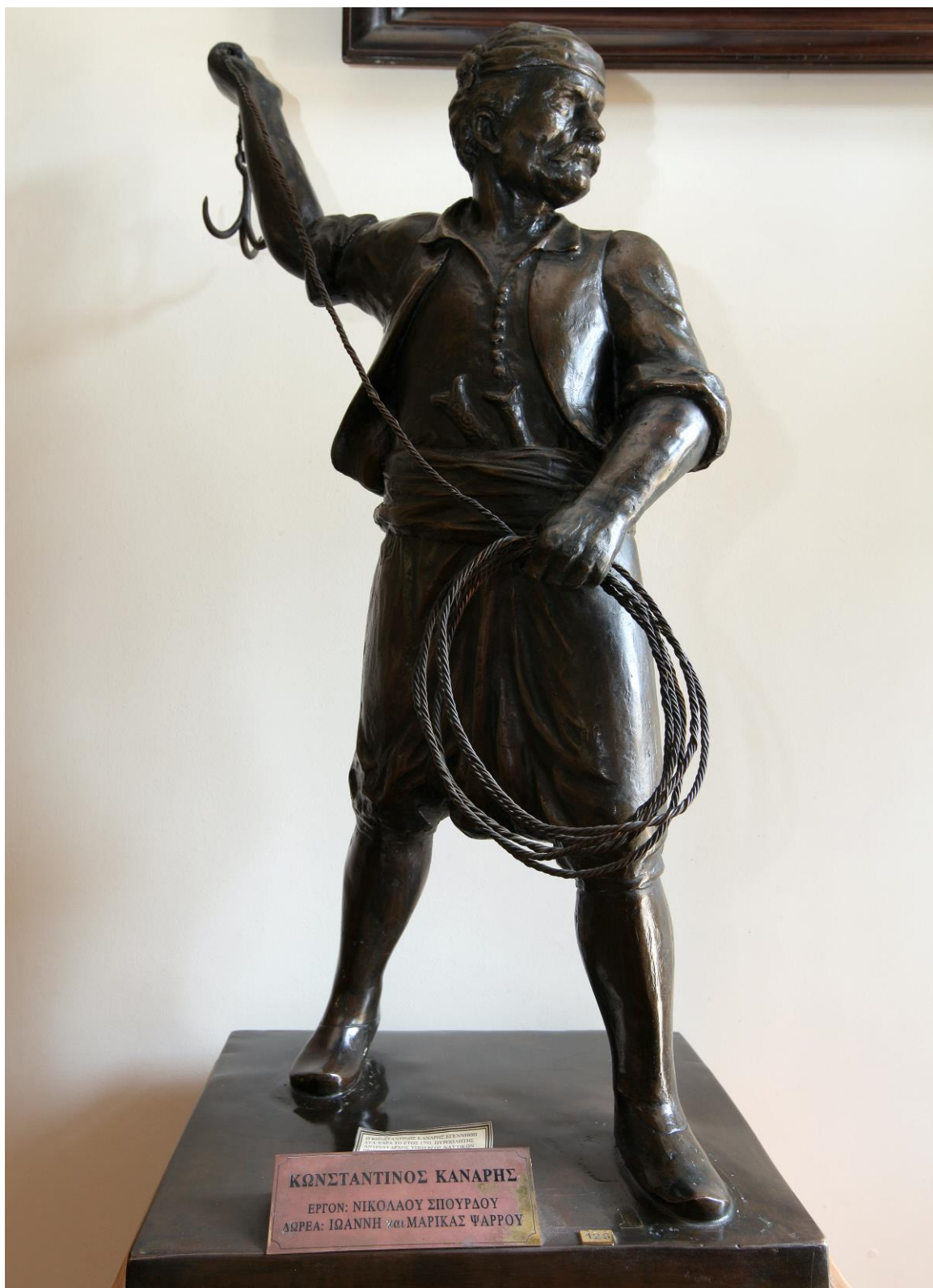
Φωτ.6: Κωνσταντίνος Κανάρης, Ναυτικό Μουσείο Χίου

Σημ: Το επετειακό αυτό σημείωμα σχεδιάζεται να τυπωθεί σε συνεργασία με την Επιτροπή Επετειακών Εκδηλώσεων Δήμου Χίου «Χίος 2021» στο πλαίσιο της συμμετοχής του ΤΝΕΥ στον εορτασμό των 200 χρόνων της Ελληνικής Επανάστασης.