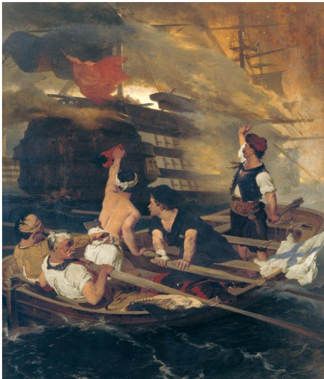
Φωτ.2: Ν.Λύτρα, Η πυρπόληση της τουρκικής ναυαρχίδας από τον Κανάρη https://el.wikipedia.org/wiki/Πυρπόληση_Τουρκικής_Ναυαρχίδας_στη_Χίο_(1822)