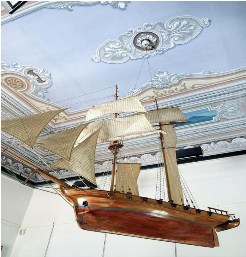
Φωτ.1: Μοντέλο ιστιοφόρου πλοίου υπό κλίμακα Ναυτικό Μουσείο Χίου

«Ναυς δε παρέχοντες» κι όχι «φόρου υποτελείς» ο Θουκυδίδης μας παραδίδει πως οι Χίοι «αυτόνομοι ξυνέσποντο» στην εκστρατεία της Σικελίας τον 5 ο π.Χ. αιώνα ενώ, το ένα μετά το άλλο, τα στρώματα των διαδεχόμενων στο χρόνο οικισμών που αναδύθηκαν μέσα από τις αποκαλυπτικές ανασκαφές στον Εμποριό, διηγούνται τη βαθιά ελληνικότητα του νησιού που αναπτύσσεται με μια θάλασσα να το χωρίζει μα και να το ενώνει με την απέναντι ακτή στην Ιωνία. Εκεί από όπου, αιώνες αργότερα, ο Αδαμάντιος Κοραΐς θα ξεκινήσει τη ζωή και την πνευματική του Οδύσσεια. Χρόνια πολλά μετά το θάνατο του θα είναι τα πλοία που θα φέρουν στο νησί των προγόνων του και δική του άπιαστη Ιθάκη τη συλλογή βιβλίων και τεκμηρίων του. Μαζί και την υπόμνηση πως η διασπορά των Χιωτών, μέσα από εθελούσιες εξορίες και μαρτυρικές διώξεις θα είναι εκείνη που θα κρατήσει ψηλά τη σημαία του πολύπαθου νησιού στο πνευματικό όπως και στο ευρωπαϊκό εμποροναυτιλιακό γίγνεσθαι. Ήδη, λίγες δεκαετίες μετά την Καταστροφή της Χίου, δεκάδες θα είναι και τα Χιώτικα ονόματα ανάμεσα στα μέλη του περίφημου Baltic Exchange του Λονδίνου, του κέντρου των ναυτιλιακών συναλλαγών της εποχής.